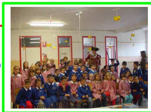
Scuola primaria Passatempo Classe I

Capitan Eco, il grande pirata a scuola a trovarci un giorno è venuto e con un bell'inchino ci ha fatto un saluto poi ci ha detto: "Cari bambini, se vorrete avere una bella sorpresa imparar dovrete a riciclare la spesa!" Noi bambini tutti emozionati all'isola ecologica così siamo andati, con le nostre mamme abbiamo portato cartone, plastica e ferro ammucchiato. Abbiamo ricevuto tante eco-monete argentate e nel salvadanaio le abbiamo buttate! Il salvadanaio è pieno oramai, caro Capitano, che sorprese ci darai?