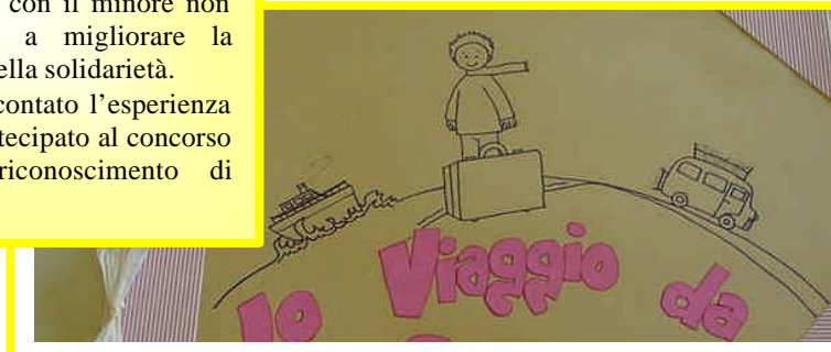
Scuola primaria Passatempo Classe 2